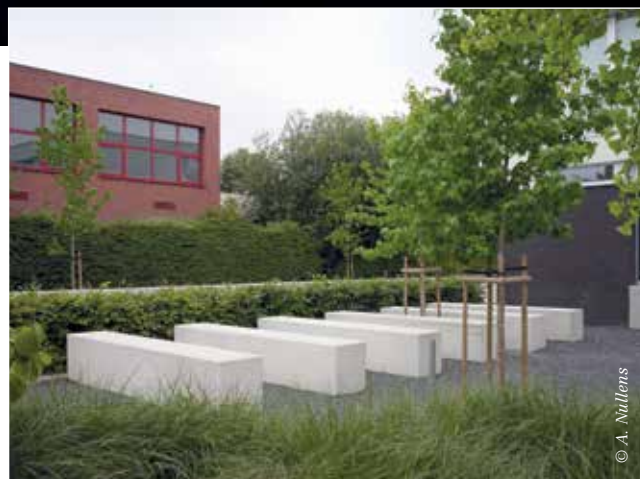
Beton is een interessant materiaal voor straatmeubilair met een strakke vormgeving.

"Of we nu in Londen of Shanghai zitten, overal is het beursconcept herkenbaar en identiek. Die copy-paste gaat heel ver, zo nemen we zelfs de Panton chairs die we hier gebruiken mee naar het buitenland. En het team dat in Kortrijk de beurs opbouwt, doet dat op alle andere locaties. Alleen voor de randactiviteiten met tentoonstellingen en seminars houden wij rekening met de lokale interesses. In elk land geniet de beurs de steun van de beroepsverenigingen van architecten